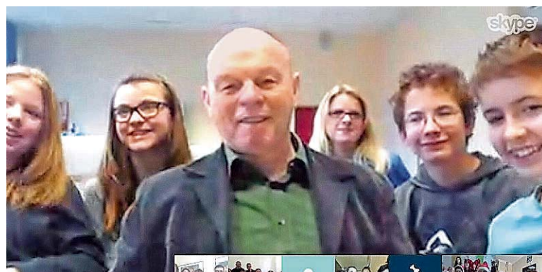
Die Weiskircher sind online.

In das Stimmengewirr von sich herzlich grüßenden Lehrern und übereifrigen Schülern musste der Weiskircher Schulleiter schließlich eingreifen. Er sorgte für Ruhe, und alle hörten auf sein Kommando. „Erste Anweisung war, nur wer spricht hat seine Kamera eingeschaltet, und alle anderen hören und schauen zu“, erzählt Pfeifer. „Anders war es unmöglich, zumindest halbwegs Ordnung zu halten.“ Er rief, wie er berichtet, der Reihe nach die einzelnen Schulen auf, damit sie sich vorstellen und Grüße übermitteln konnten. „Die Grüße fielen sehr unterschiedlich aus“, erinnert sich der Schulleiter, „die Lu-